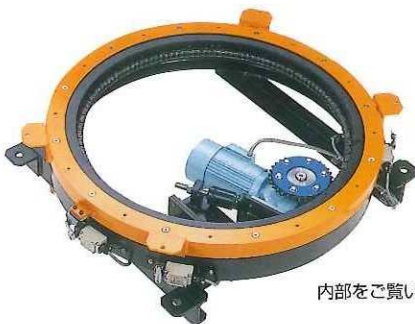
内部をご覧いただくため天板をはずして撮影