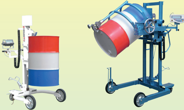
RXL-3-S (デジタル計量器付)