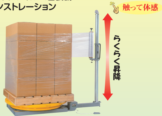
MD-W10 (ストレッチフィルム包装機)