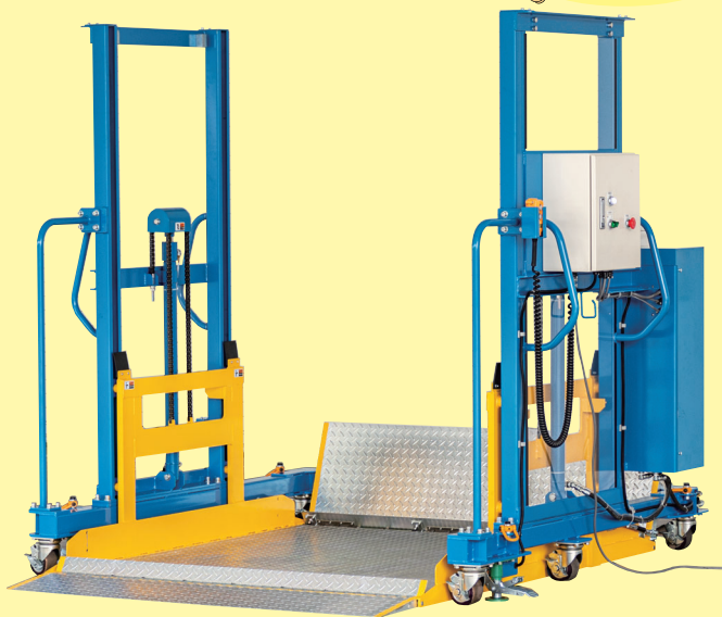
荷積み・荷降ろし用 テーブルリフター AgesaGate(アゲサゲート) AG-1500