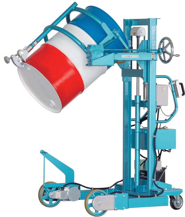
ドラム缶反転投入機 ドラムダンパー DM-1100-S EasyAssist搭載仕様